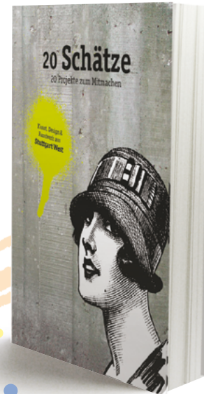
Das Buch zum Jubiläum